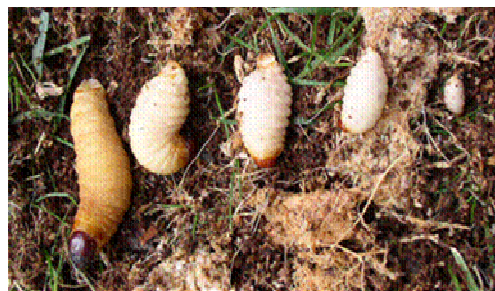
Fotografía 2: Distintos estados de crecimiento de larva de Rhynchophorus ferrugineus Olivier.

Al eclosionar los huevos, salen las larvas que presentan al principio un color blanquecino el cual va tomando una tonalidad amarillento oscuro a medida que avanza el ciclo. Es ápoda, alargada, segmentada y con una cabeza endurecida de color rojo-marrón oscuro, provista de unas fuertes mandíbulas cónicas. Al final de la fase, la larva puede llegar a tener 5 cm de longitud. El periodo larvario necesita de 1 a 3 meses para completarse y está fuertemente influenciado por la temperatura. La larva se alimenta del tejido vegetal interno de la palmera y como consecuencia de esta acción deja una serie de galerías internas que pueden llegar hasta un metro de longitud. Es la fase del insecto que más daño causa a la palmera y en particular a la palmera canaria al localizarse en el tejido meristemático (de crecimiento) de la misma.