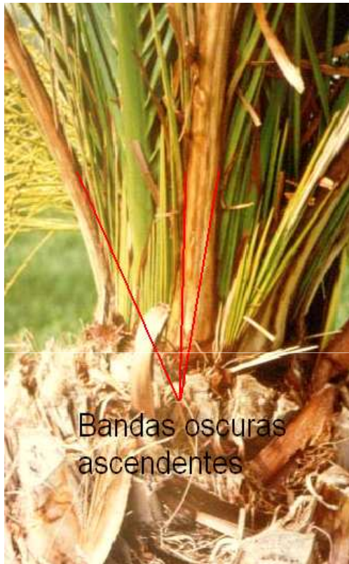
Bandas oscuras ascendentes