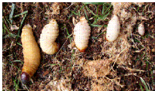
Fotografía 2: Distintos estados de crecimiento de larva de Rhynchophorus ferrugineus Olivier.

Al eclosionar los huevos, salen las larvas que presentan al principio un color blanquecino el cual va tomando una tonalidad amarillento oscuro a medida que avanza el ciclo. Es ápoda, alargada, segmentada y con una cabeza endurecida de color rojo-marrón oscuro, provista de unas fuertes mandíbulas cónicas. Al final de la fase, la larva puede llegar a tener 5 cm de longitud. El periodo larvario necesita de 1 a 3 meses para completarse y está fuertemente influenciado por la temperatura. La larva se alimenta del tejido vegetal interno de la palmera y como consecuencia de esta acción deja una serie de galerías internas que pueden llegar hasta un metro de longitud. Es la fase del insecto que más daño causa a la palmera y en particular a la palmera canaria al localizarse en el tejido meristemático (de crecimiento) de la misma.