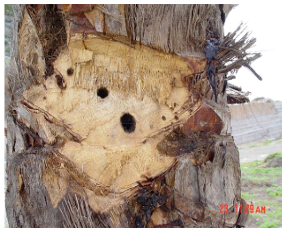
Fotografías 8 y 9: Síntomas que presentan Phoenix dactylifera L. afectada por Rhynchophorus ferrugineus Olivier en el Barranco de Medio Almud, Mogán (Gran Canaria)