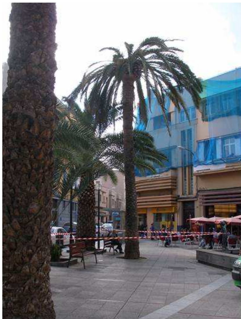
Fotografía 5: Síntomas que presenta Phoenix canariensis Hort. Ex. Chavaud afectada por Rynchophorus ferrugineus Olivier. Plaza de Farray en Las Palmas de GC

Todos estos daños, causados por larvas y adultos en su alimentación, se hacen patentes y visibles demasiado tarde, y cuando los primeros síntomas de infestación aparecen, son tan graves que tienen como resultado la muerte de la palmera.