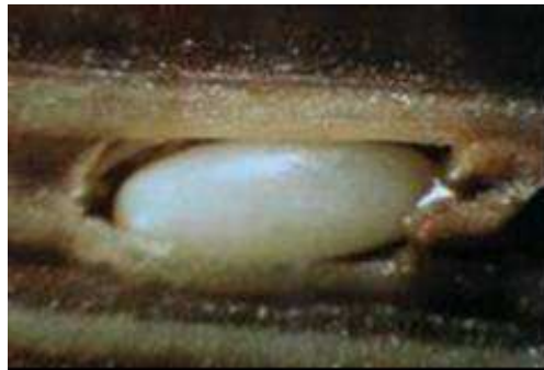
Fotografía 1: Huevo de Rhynchophorus ferrugineus Olivier.

El huevo, de color amarillo claro, blanquecino, cilíndrico, brillante, tiene forma ovalada y mide de 1 a 2,5 mm. Se localizan en el interior de grietas, heridas o de pequeñas cámaras en forma de agujero realizadas por las hembras, son colocados de manera independiente o conjunta pero sin entrar en contacto unos con otros. En la ovoposición las hembras doblan los tarsos hacia arriba y se anclan al tejido con las espinas de las tibias apoyándose en el tercer par de patas hasta poner en contacto el ovopositor con el sustrato. Los huevos quedan protegidos y fijados con una secreción. Realizan puestas que van de 300 a 400 huevos de media . Esta fase tiene una duración de 2 a 4 días.