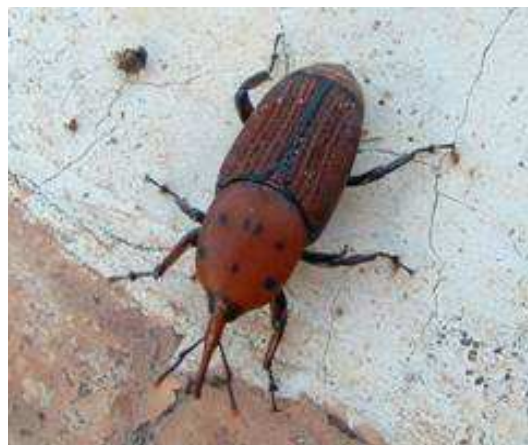
Fotografía 4: Adulto de Rhynchophorus ferrugineus Olivier.

El adulto puede vivir de 45 a 90 días, tiene el cuerpo oval alargado de 19 a 45 mm de longitud, de coloración variable; pardo anaranjado claro o rojo ferruginoso, con o sin manchas negras en el pronoto de forma y números variables. Rostro alargado, en el macho está recubierto de un cepillo de setas mientras que en las hembras es liso. No abandonan la palmera inmediatamente sino cuando ya está en avanzado estado de descomposición o cuando son atraídos por sustancias procedentes de otras palmeras como consecuencia de las podas. Tienen actividad diurna, prefieren caminar aunque normalmente vuelan para encontrar otra palmera que infectar.