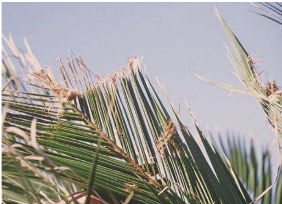
Fotografía 7: Daños en hojas jóvenes con restos de carcoma.