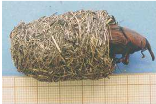
Fotografía 3: Adulto emergiendo del capullo o croqueta.

Al final del periodo larvario la larva construye una envoltura en forma oval con fibras del interior de la palmera. Estos capullos tienen una longitud de 4 a 6 cm, se localizan en las bases de las hojas y en su interior se encuentra la larva-pupa. Esta fase dura de 15 a 30 días. Una vez finalizada la metamorfosis el adulto permanece en el interior unos 10 días más.